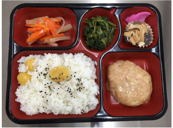
こひつじ舎弁当の一例

「風のテーブル」は三鷹市内在住の子ども（18歳まで）およびその家族を対象に、無料で食事（昼食・夕食）を提供するサービスです。福祉サービス事業所「巣立ち風」での食事提供および弁当の配食サービスを行います。アレルギーのある方はお申し出ください。