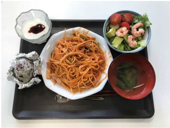
巣立ち会食事会のメニューの一例