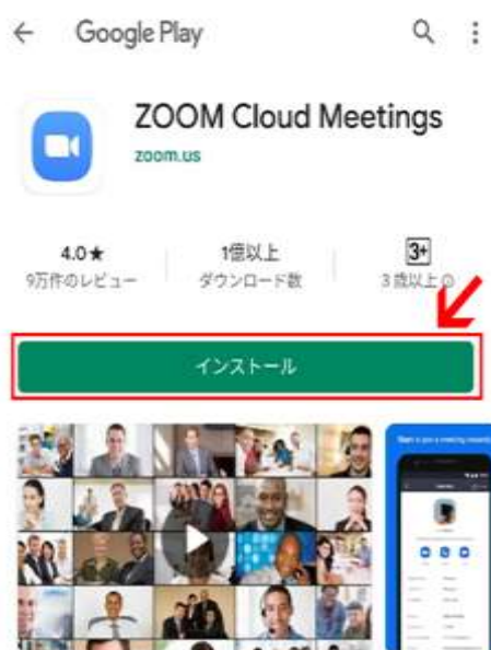
Google Play の場合