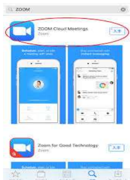
Apple Store の場合